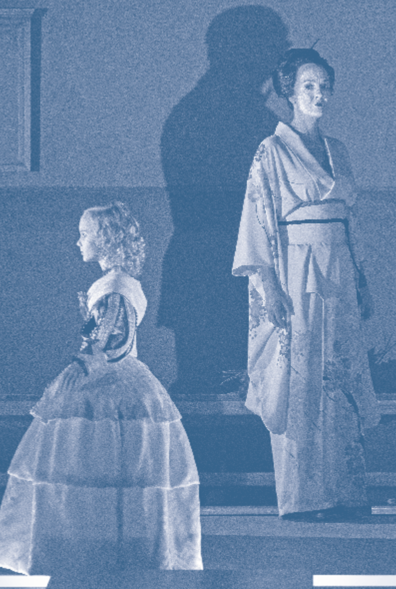
Die Sache Makropulos Staatsoper Unter den Linden, Berlin