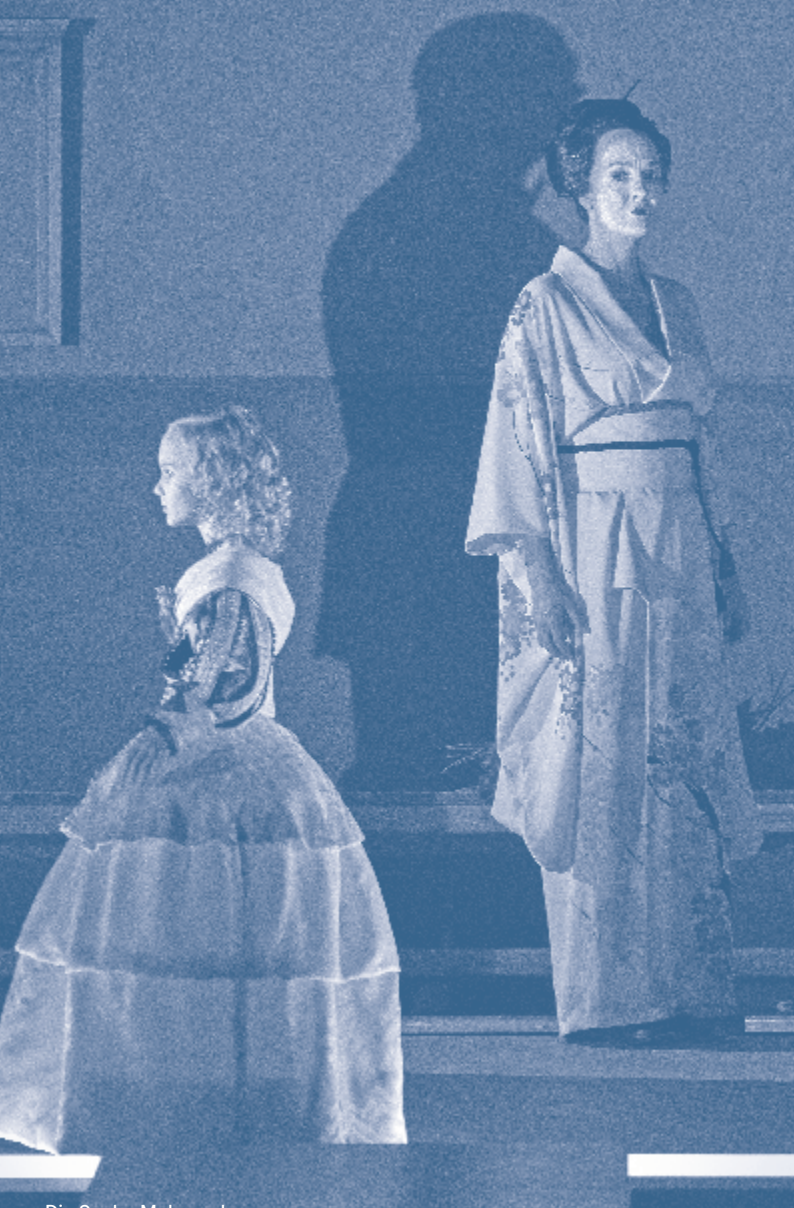
Die Sache Makropulos Staatsoper Unter den Linden, Berlin